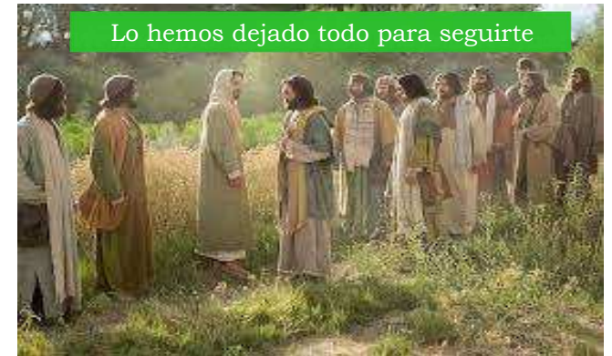
Lo hemos dejado todo para seguirte

4 de Septiembre, 2022 XXIII DOMINGO DE TIEMPO ORDINARIO