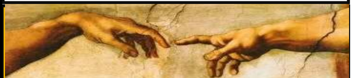
The Crown of Creation: The Image of God and You

Todavía estamos tomando botellas y latas para reciclar para beneficio de nuestro Fondo de Mantenimiento. Puede traerlos de martes a viernes de 9 a.m. a 3 p.m. Ven a la puerta trasera del edificio de administración y toca el timbre y alguien abrirá la puerta. Gracias por su donación.