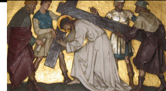
Walking with Jesus